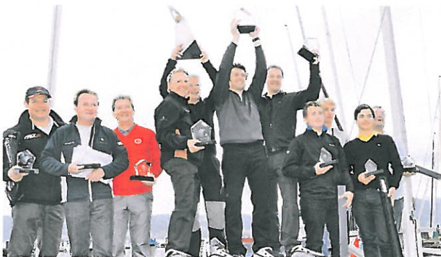
Auch im Vorjahr war der Event ein großer Erfolg – unvergesslich für alle Teilnehmer.