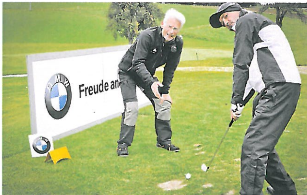
Das Golfturnier wird in Form eines Texas-Scramble als Zählwettbewerb ausgetragen.